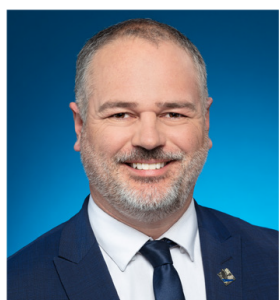
JONATAN JULIEN Député de Charlesbourg